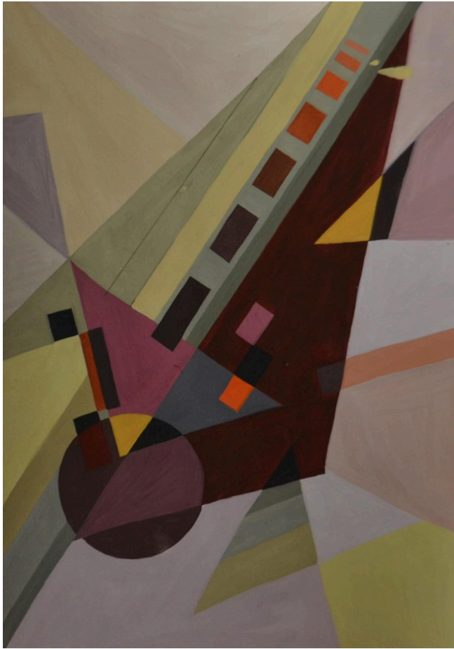
Іл. 3. Динаміка, тепла гама

Порядок проведення та критерії оцінювання вступних випробувань регулюється Положенням про організацію вступних випробувань у Прикарпатському національному університеті імені Василя Стефаника.