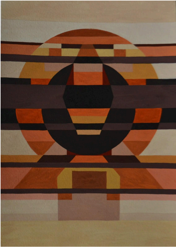
Іл. 1. Статика, тепла гама