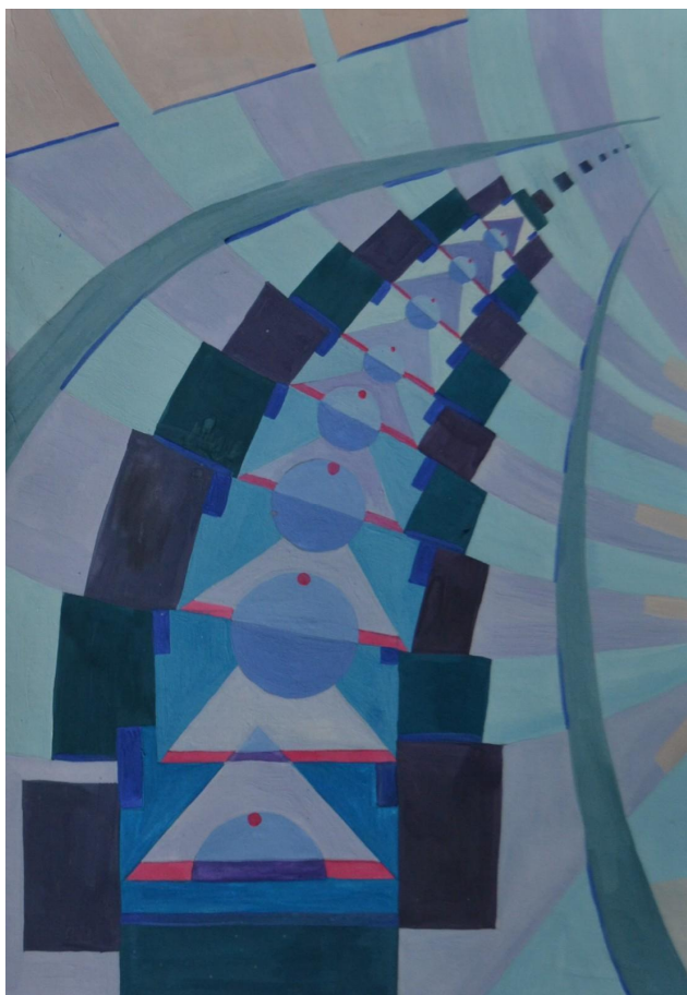
Іл. 3. Динаміка, холодна гама